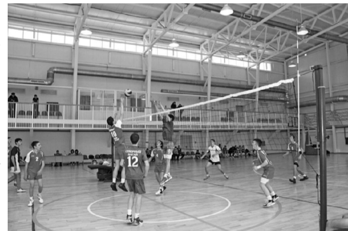
На снимке: на паркете Вагайские и Черноковские волейболисты