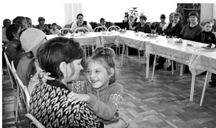
Фото и текст Тамары БЫЧКОВОЙ.

Мероприятие закончилось чаепитием и весёлыми детскими играми.