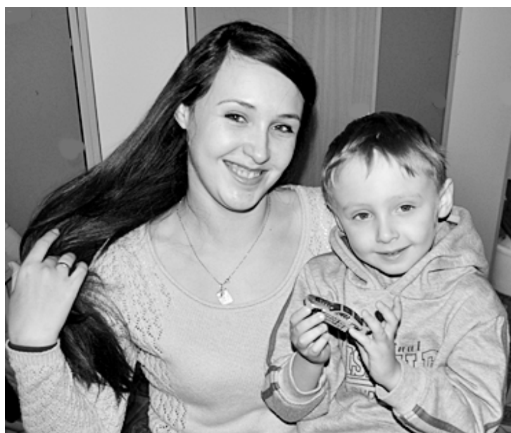
Фото и текст Тамары БЫЧКОВОЙ.

сещает изостудию и танцевальный кружок. Савелию нравится коллективно ходить в сорокинский спортивный центр «Сибирь». Там работает инструктором-методистом по настольному теннису его папа. Наш сын мечтает стать то знаменитым спортсменом, то врачом... В будущем мы видим своего ребёнка успешным человеком.