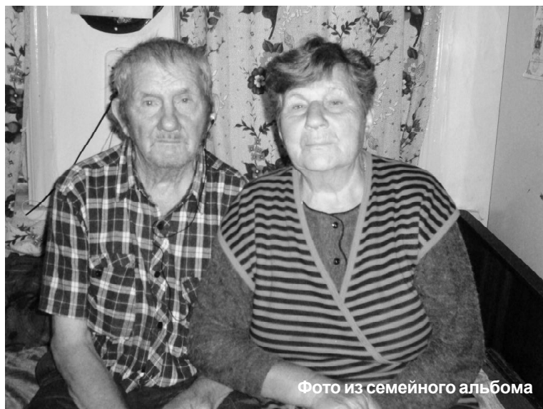
Фото из семейного альбома