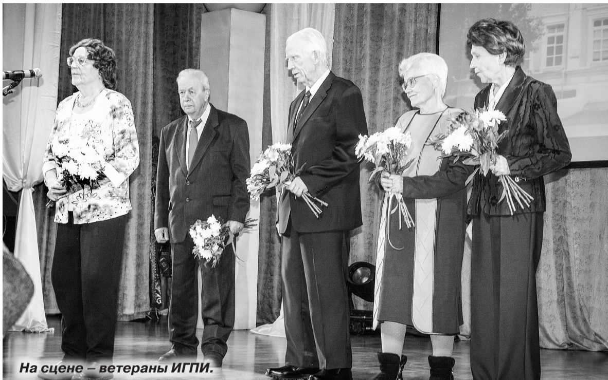
На сцене – ветераны ИГПИ.

Историческую эстафету подхватила выставка в фойе «тридцатки».