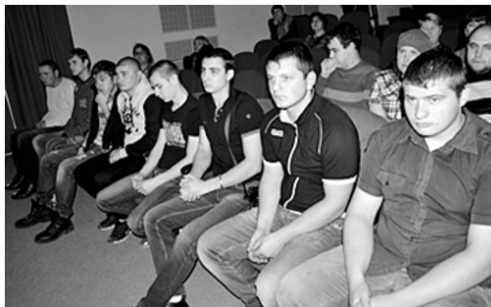
Фото и текст Тамары БЫЧКОВОЙ.

конкурса «Мастер Тюменской области» – от департамента культуры Тюменской области.