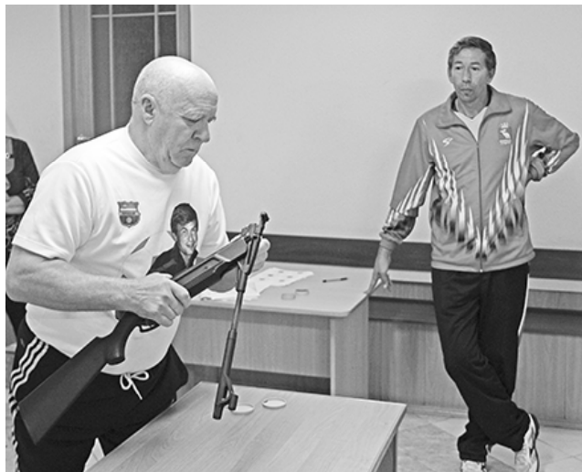
* С винтовкой наперевес

— Волейбол, дартс, стрельба, бочка — в этих дисциплинах планирую сегодня сразиться с соперниками. Я тоже второй год на подобных соревнованиях. В прошлом году стал победителем в бочке, по другим видам занял призовые места. Сегодня у меня нормальный спортивный настрой. Думаю, что и в этот раз добьюсь хороших результатов!