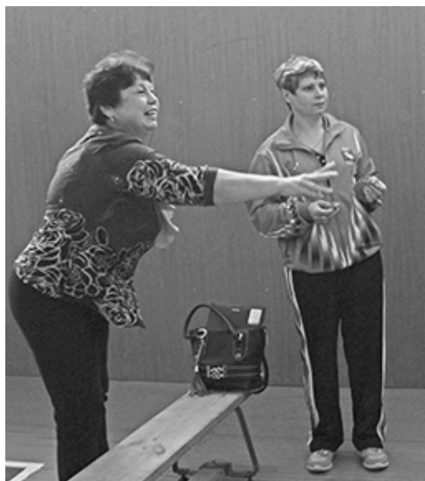
* Тренируем меткость