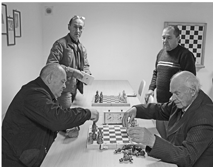
* Подготовка к «битве»