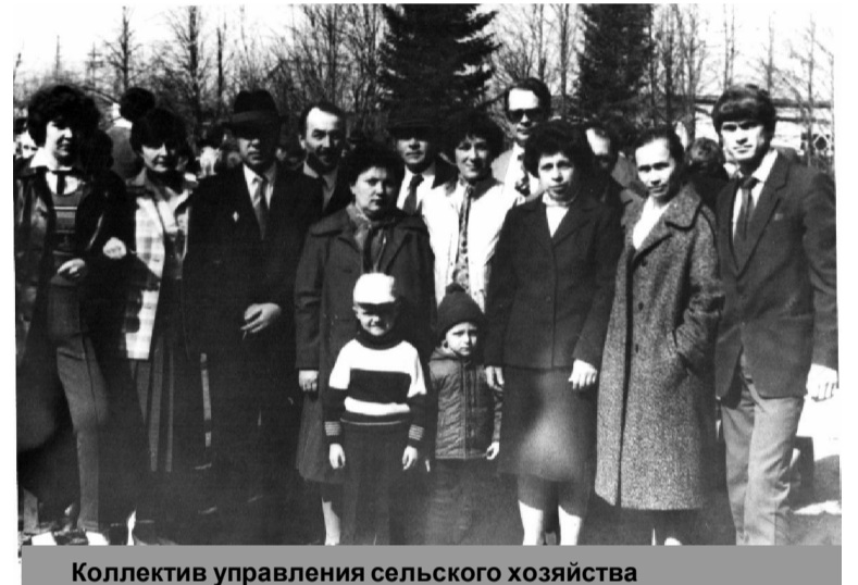
Коллектив управления сельского хозяйства

«Эффективными менеджерами» списывались все долги, материальная часть продавалась направо - налево, скот шел под «нож» и на мясокомбинат. Орудия труда были у крестьян изъяты, не стало возможности обрабатывать землю, в результате десятки тысяч гектаров земель в районе оказались заброшенными.