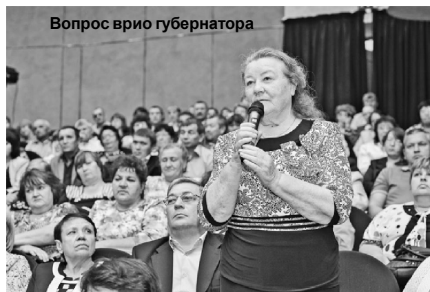
Вопрос врио губернатора

ческому развитию вверенной ему территории. За последние годы в районе произошло много позитивных изменений: благоустраиваются населенные пункты,