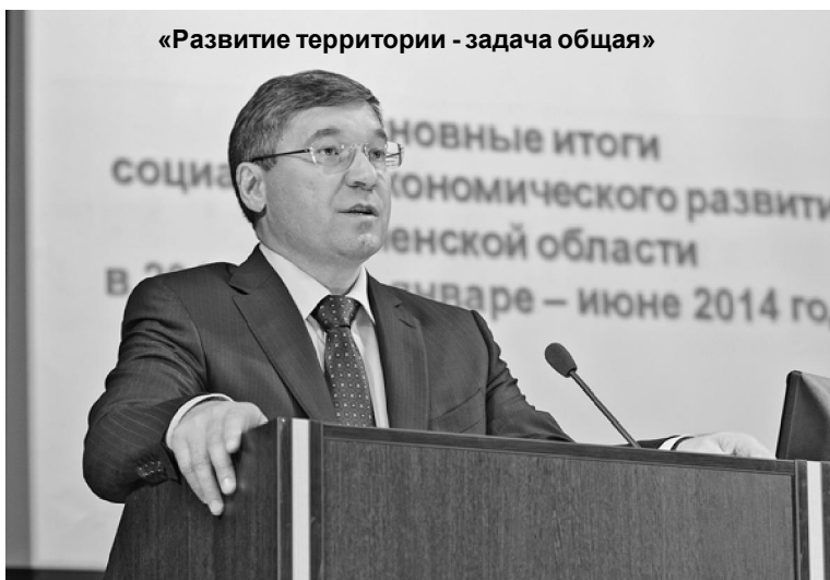
«Развитие территории - задача общая»

Шестнадцатого июля с рабочим визитом наш район посетил временно исполняющий обязанности губернатора Тюменской области Владимир Владимирович Якушев.