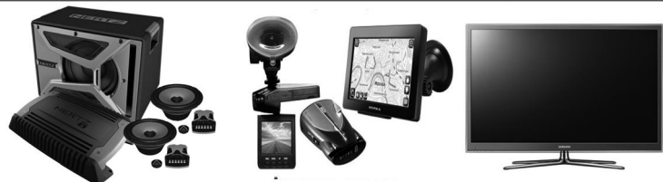
Автомагнитолы, Видеорегистраторы, Телевизоры акустика, сабвуферы, навигаторы.

ИП Однорядцевой С.А. на хлебопекарню ТРЕБУЮТСЯ пекари, диспетчер, уборщица. Телефон 89220423111.