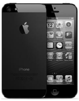
Смартфоны, сотовые телефоны

с. Вагай, ТЦ Южный, 1 этаж ул. Ленина, 16А тел. 23-1-16