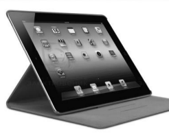
Планшеты с 3G