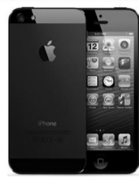
Смартфоны, сотовые телефоны

с. Вагай, ТЦ Южный, 1 этаж ул. Ленина, 16А тел. 23-1-16