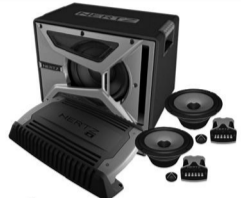
Автомагнитолы, Видеорегистраторы, Телевизоры акустика, сабвуферы. навигаторы.