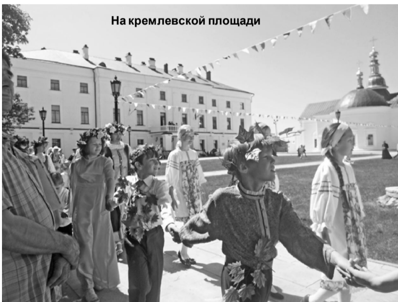
На кремлевской площади

В свою очередь Патриарх Кирилл обратился к митрополиту Димитрию, и.о. губернатора и ко всем, собравшимся в храме: «Ваши Высокопреосвященства, дорогие братья и сестры, многоуважаемый Владимир Владимирович, я хотел бы выразить чувство глубокого удовлетворения в связи с тем, что, не смотря