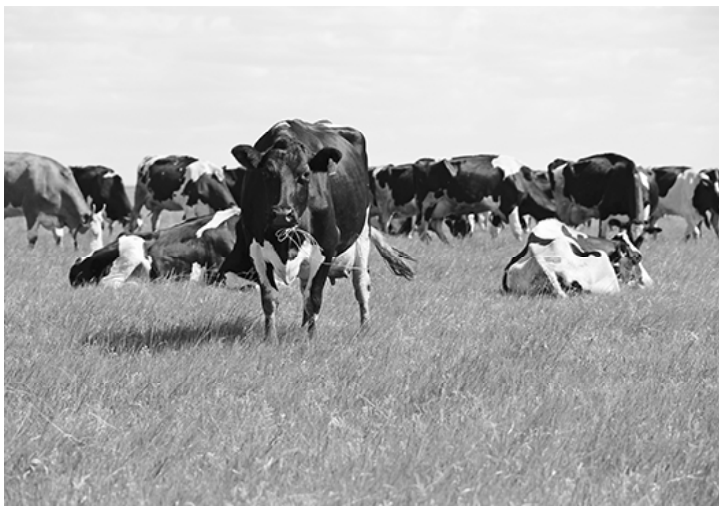
* Голштинофризки на выпасах