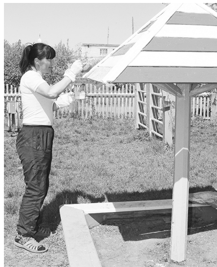
* Обновление «грибка»