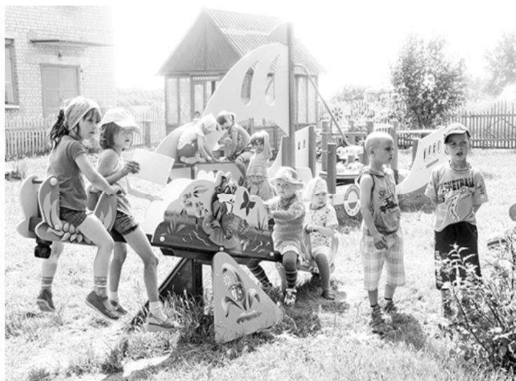
* «Вот так у нас красиво!»