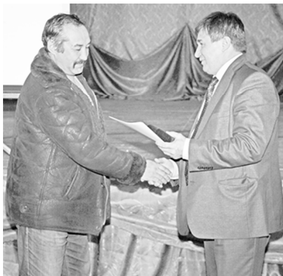
* Заслуженные награды