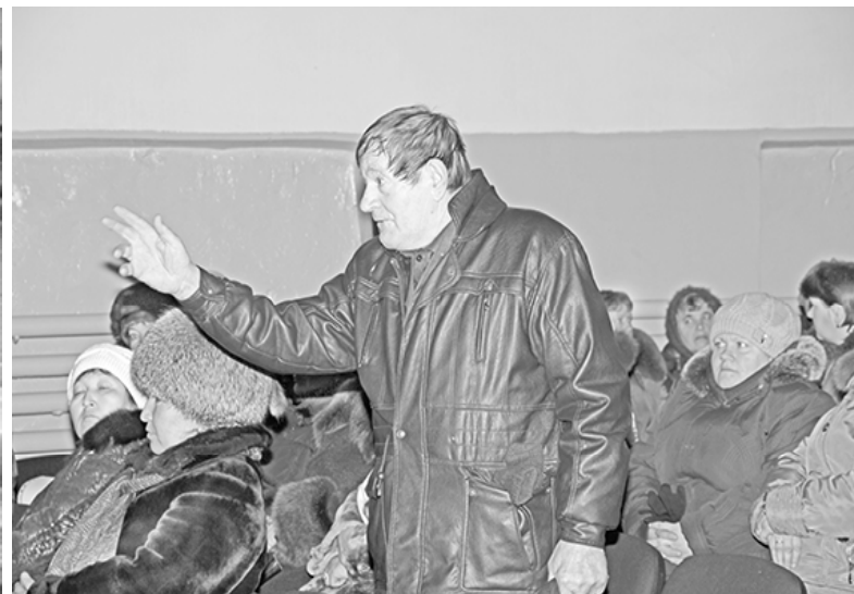
* Обращение к власти