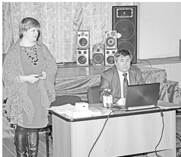
* Отчёт Е.М.Харитоновой