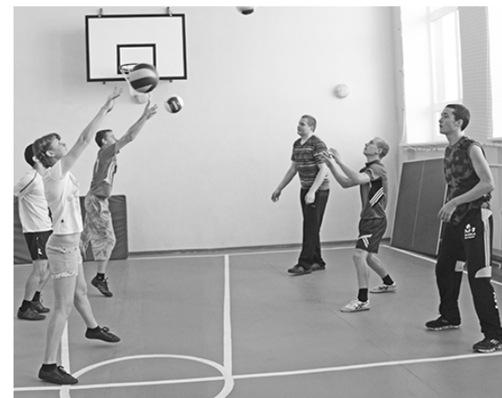
* На спортивной секции

— Нам интересно создавать роботов, выполнять с ними разные задания, это очень увлекает. Мы с удовольствием приходим на кружок и стараемся сделать более сложные модели, учимся думать, размышлять, — признаются ребята, сосредото-