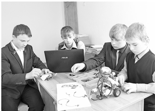
* Чем сложнее робот, тем интереснее

— Очень востребованы среди наших детей спортивные секции: волейбол, футбол, баскетбол. Занимаются учащиеся и фитнесом. Уже третий год действует специализированный класс «Гроза», где ре-