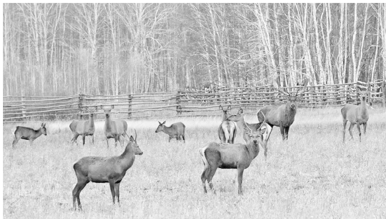
* Европейские олени в сладковских лесах.