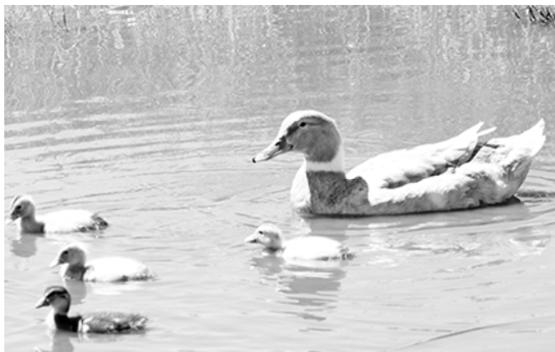
* На прогулке с мамой