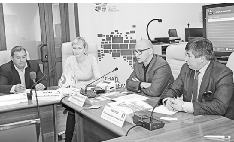
* Идёт презентация

По интересующим вопросам каждый пользователь «цифры» может обратиться в круглосуточный информационный