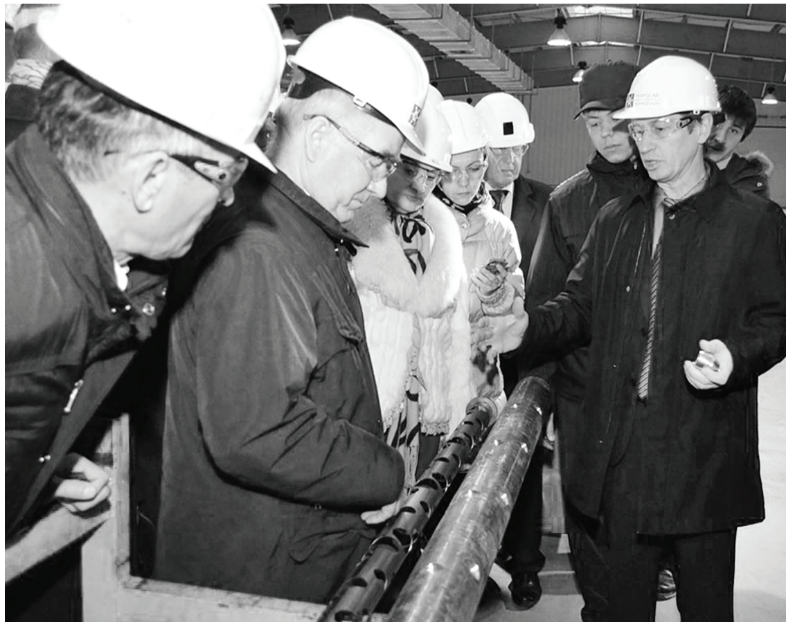
Депутаты областной Думы посетили первую очередь строительной площадки завода по выпуску перфорационных систем и оборудования к ним для нефтегазовых месторождений (Бухтал).

Во второй половине дня состоялось совместное мероприятие депутатов Тюменской