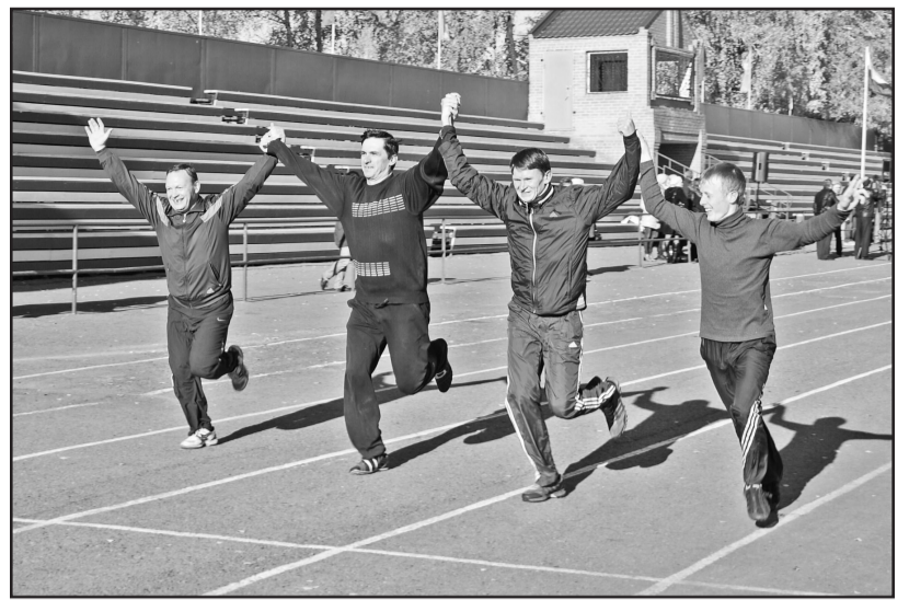
Вот такой финиш!