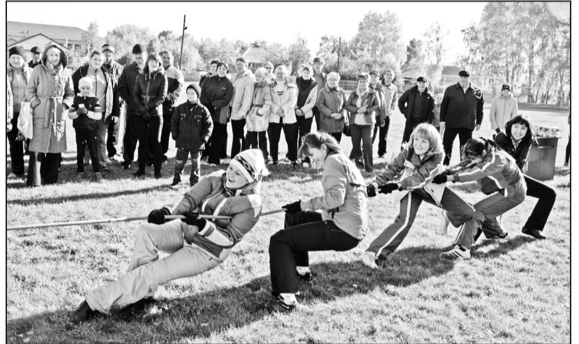
Перетягивание каната – азартная борьба