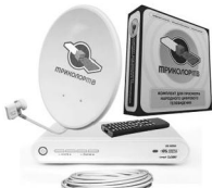
Комплект Триколор ТВ