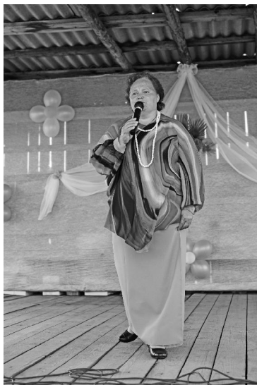
зе цветов, вокруг которых порхала бабочка. Русские поставили замечательную сценку в номи-

ли забавными ежиками, арбузы превратились в красивых лебедей и невиданных птиц, тыквы – в чайный сервиз, кабачки – в вазы с орнаментом, а в вазах красовались резные тюльпаны из перца. Вот такие вот фруктово-овощные метаморфозы. На самом же деле все эти чудеса сотворил никакой не волшебник, а жители села, представляющие разные национальности: немецкую, русскую, татарскую и чувашскую. Они объединились в команды для участия в конкурсе «Огородный». В его рамках было объявлено четыре номинации: визитка, огородный этюд, огородное пугало и талант. Каждая номинация – это маленький спектакль. Чувствовалось, что команды готовились основательно и во время представления поражали зрителей своей фантазией и виртуозностью ак-