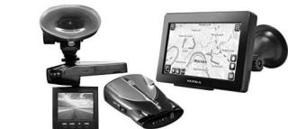
Автоэлектроника: навигаторы, видеорегистраторы, антирадары