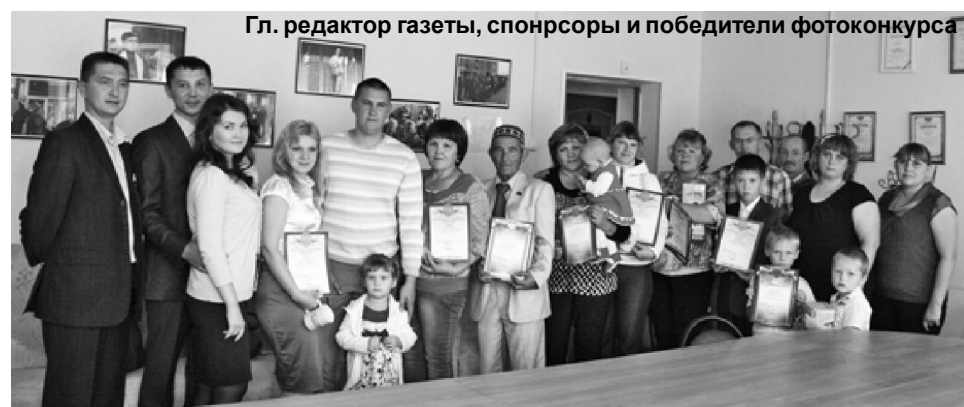
Гл. редактор газеты, спонсоры и победители фотоконкурса

В заключение хочется сказать, что конкурс состоялся! Огромное спасибо нашим читателям за активность, спонсорам – за щедрость. Будьте с нами, вас ждут