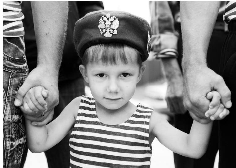
Быть тебе, пацан, десантником. Не иначе!