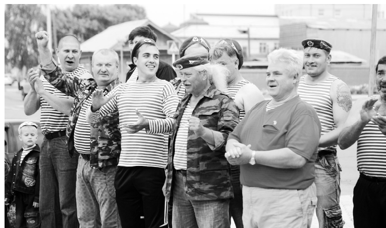
У десантников хорошее настроение

2 августа Россия отмечала 83-летие воздушно-десантных войск, чествовала армейскую «крылатую пехоту». За десантниками прочно укрепилась репутация особого рода войск - мобильного, готового к ведению боевых действий в любых, самых сложных условиях. «Никто кроме нас!» - крылатая фраза стала девизом ВДВ.