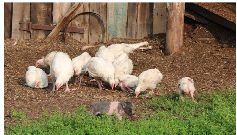
Живность вольно чувствует себя на траве: цыплята, маленький вьетнамский поросенок

вставая в 5 часов утра и ложась подчас за полночь.