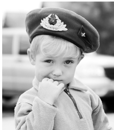
Да, 2 августа и такие «голубые береты» праздновали