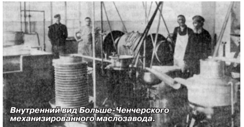
Внутренний вид Больше-Ченчерского механизированного маслозавода.

По документам окрисполкома в 1927 году отмечается снижение производства масла. «Коренная причина этого сокращения лежит в сокращении молочного стада, и вторая, не менее важная причина, в организационных недочётах масло-