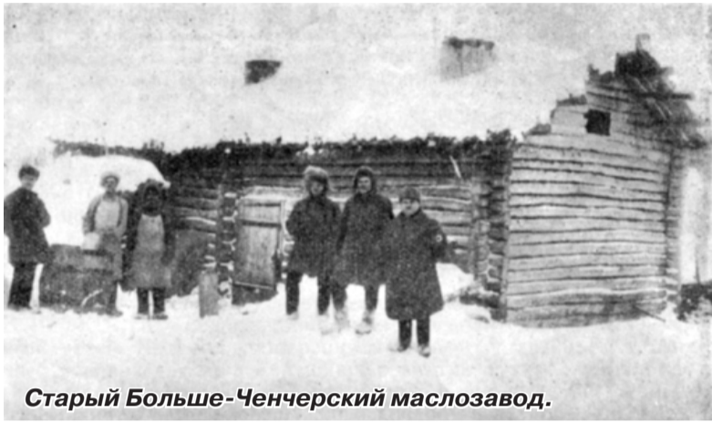
Старый Больше-Ченчерский маслозавод.

И действительно, в 1924 году на внешнем рынке было продано ишимского масла 75 837 пудов на