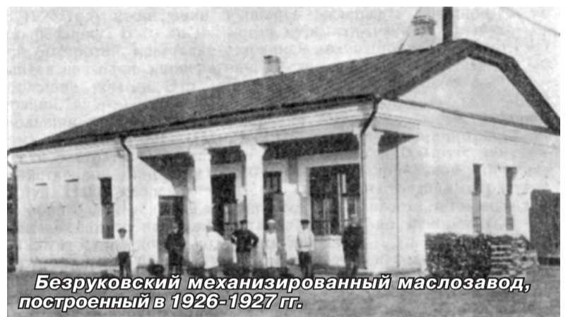
Безруковский механизированный маслозавод, построенный в 1926-1927 гг.

артелей», также отмечается низкая расплата за сдаваемое молоко на заводы, «морозная зима, болезнь ящуром скота, ...разрыв цен в сторону повышения для топлёного масла».