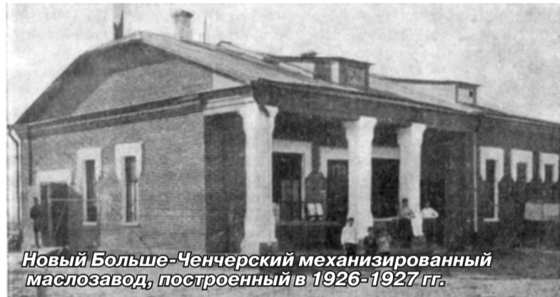
Новый Больше-Ченчерский механизированный маслозавод, построенный в 1926-1927 гг.

сумму 1 906 260 руб. (примерно 25 руб. за пуд при себестоимости 19 руб.). Однако вырученные деньги не покрыли общих затрат на заготовку масла, накладные и операционные расходы, которые составили 1 931 746 руб. В целом кампания по продаже экспортного масла в тот год принесла «недобора или убытка 25 486 руб.».