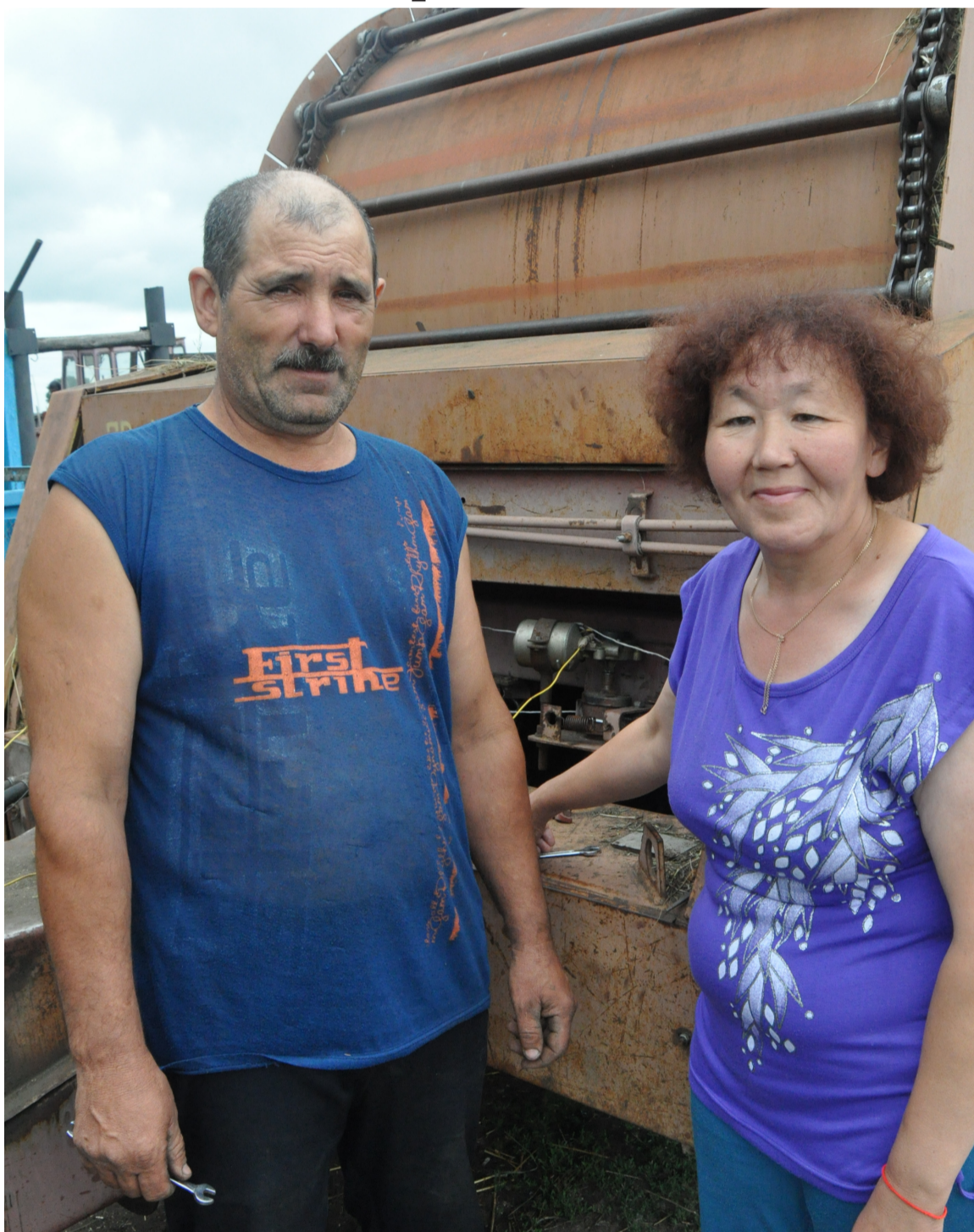
Супруги Четвёркины считают, что секрет успешности на селе – в трудолюбии