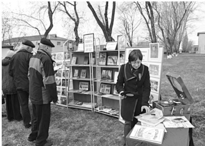
НА СНИМКЕ: 9 МАЯ. Выставка, подготовленная к Дню Победы библиотекарями центральной библиотеки.