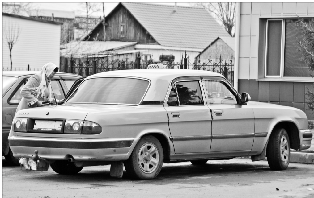
Такси — необходимый атрибут нашей жизни