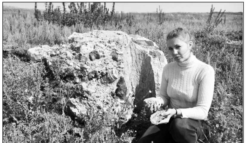
Это всё, что осталось от храма в Большой Ченчери