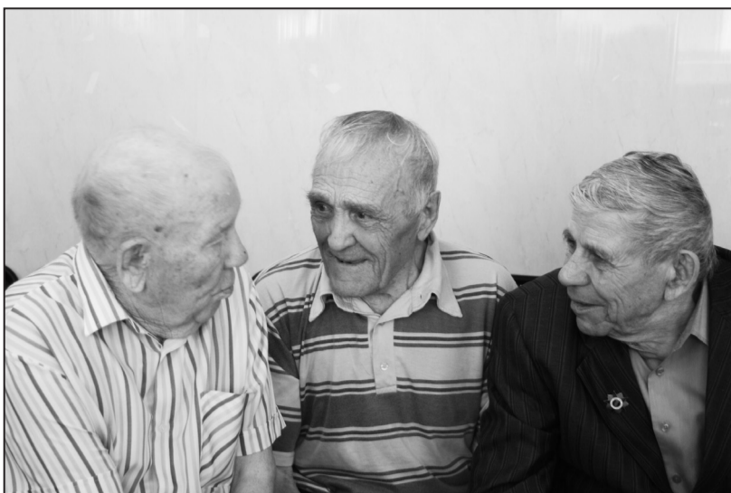
Ветеранам есть о чём поговорить, что вспомнить