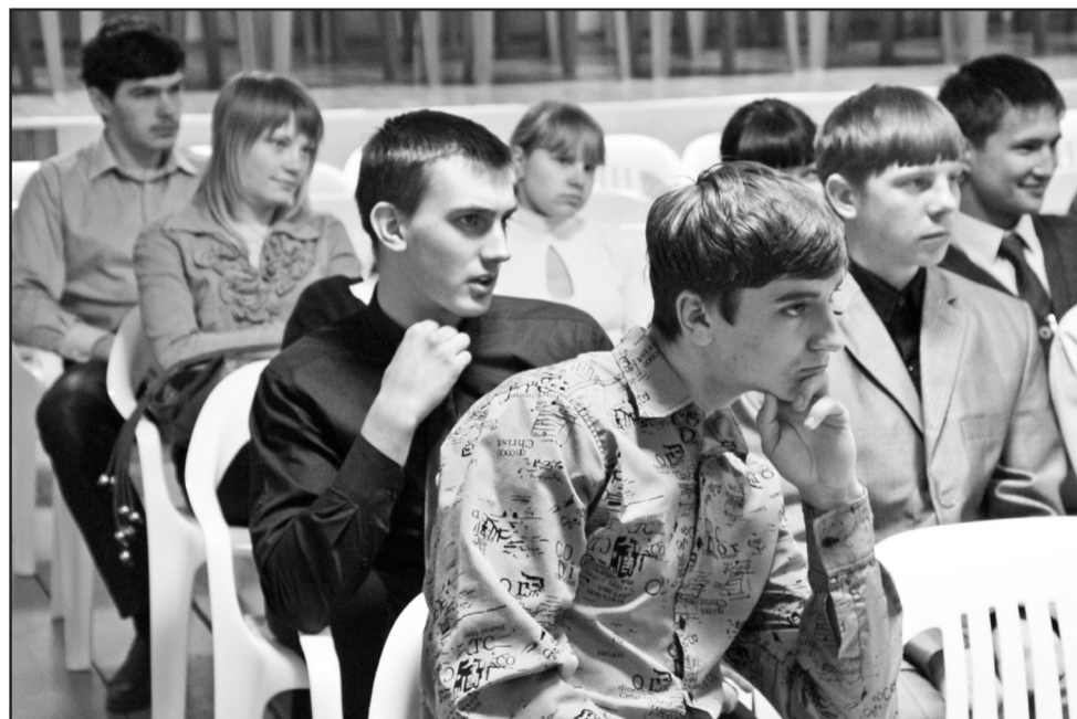
То, что старшеклассники изучают на уроках обществознания, В.И. Ульянов объяснил на живом примере

К сожалению, тем, кто ориентируется на выбор престижной профессии, придётся учесть шокирующую статистику: на 100 тысяч российских студентов 70 тысяч (!) сегодня – гуманитарии, а в оставшемся числе доля избравших инженерную, техническую или рабочую специальность ничтожно мала. Страна переполнена юристами и экономистами. Поэтому, кто мечтал после института сидеть в конторе – сидит безработным дома или устраивается не по специальности. Наступающий день диктует новые потребности и новый престиж – это надо запомнить. А ещё хорошо бы запомнили выходящие в большой мир ребята наказ человека, прошедшего путь от ученической парты в сельской школе до депутатского кресла: «Стремиться, цепляться и не комплексовать!»