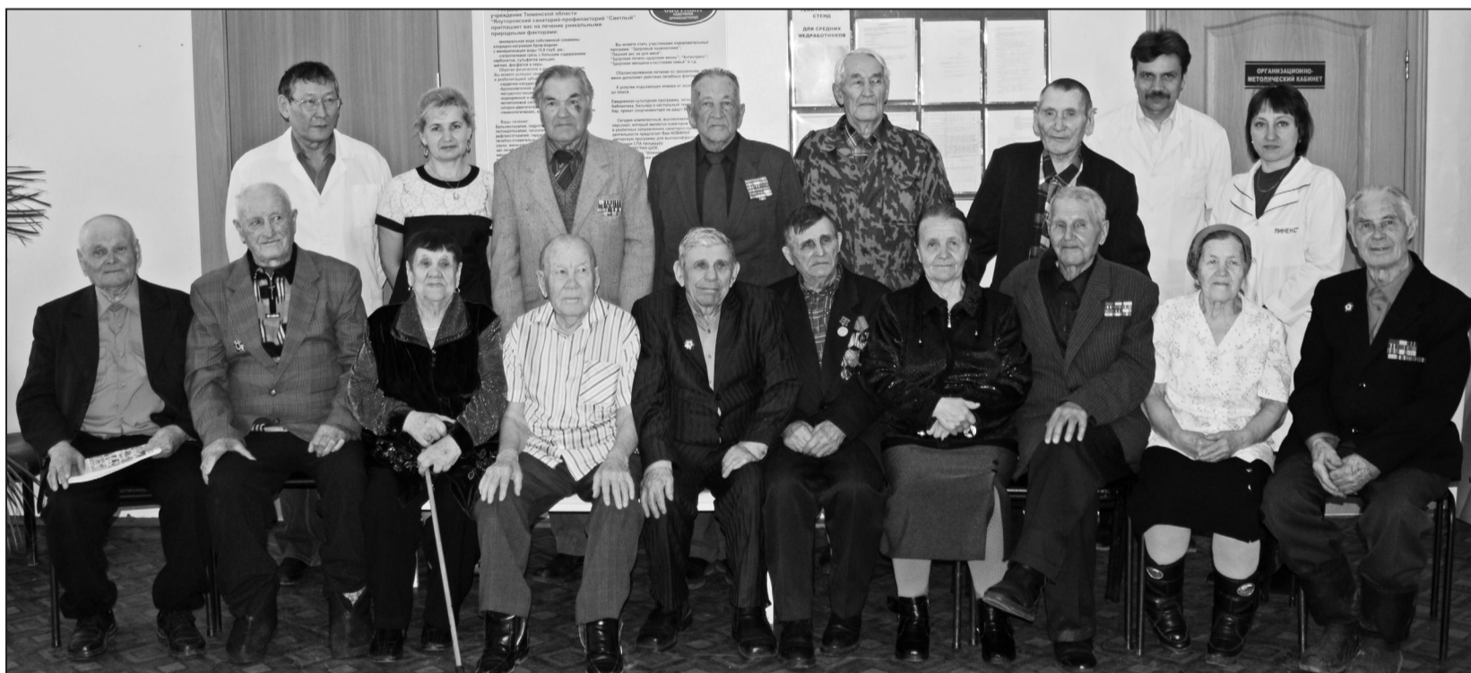
Фото на память о встрече

Диспансеризация была чётко организована и прошла очень тепло, нестандартно. В заключение встречи все сфотографировались на память.