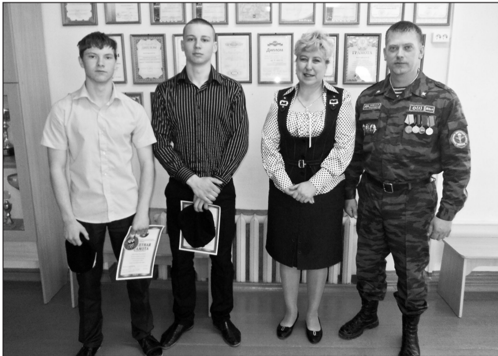
После торжественного вручения шевронов

Экзамен на выносливость, силу, терпение среди слушателей кадетских классов, приехавших из шести районов и городов Тюменской области, состоялся 14 апреля 2013 года в Юрге.