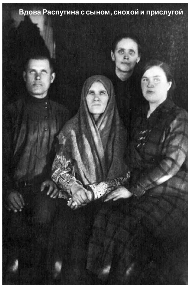
Вдова Распутина с сыном, снохой и прислужгой