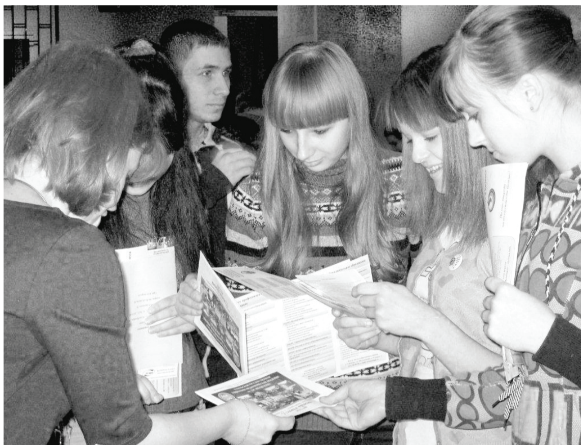
Красочно иллюстрированные брошюры, комментарии представителей учебных заведений – и определиться с выбором будущей профессии становится легче.

Всего было представлено 13 учебных заведений: Тюменский педагогический колледж №1, Тюменский нефтегазовый университет, Тюменская государственная академия культуры, искусств и социальных технологий, Тюменский лесотехнический техникум, государственный аграрный университет Северного Зауралья, Тюменский государственный университет и многие другие.