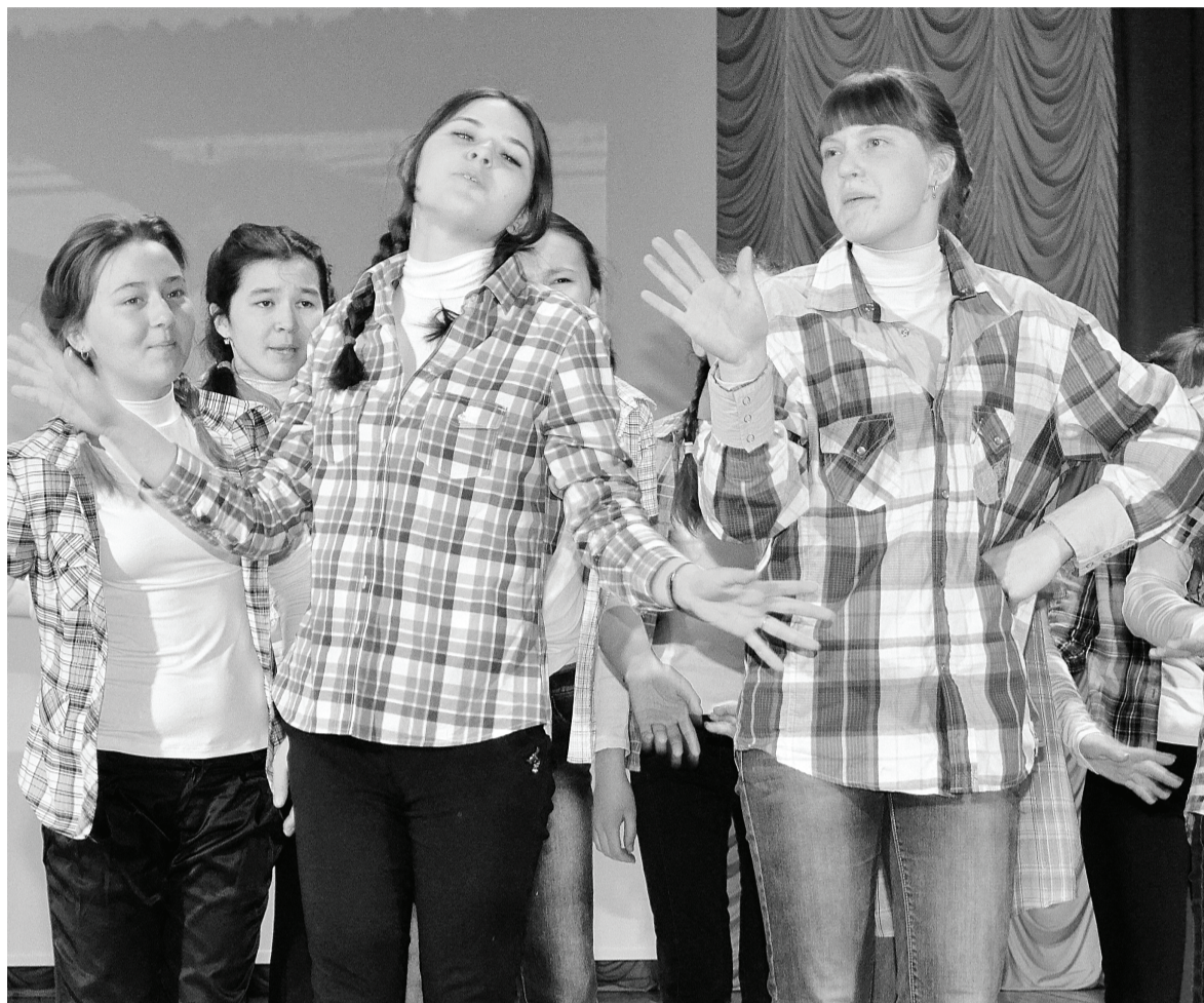
Необычно подошли к отчёту о проделанной работе ребята из Бухталовской средней школы. Музыкально-театрализованная визитка тимуровцев «зацепила» не только жюри, но и зрителей. В результате – победа в номинации «За оригинальность идеи».

Самыми яркими, запоминающимися были визитки тимуровских отрядов «Феникс» Новоникольского, «Мы» Канашского и «ЭРОН» Тарманского образовательных учреждений. Они заняли первое, второе, третье места соответственно. Ребята не только показали слайд-шоу о проделанной работе, но и кре-