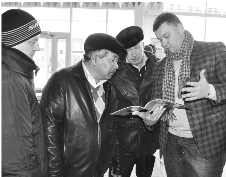
Представитель одной из компаний-поставщиков рассказал руководителям КФХ о новинках в машиностроении

Средства защиты растений, запасные части под заказ, дождевальные машины, насосные станции, пластиковые изделия коммунально-бытового и иного