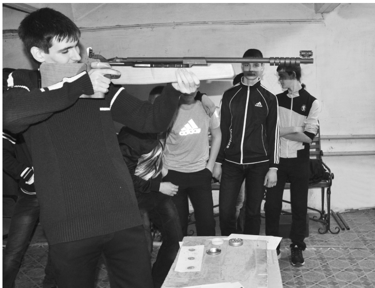
В ИСШ № 2 немало метких стрелков