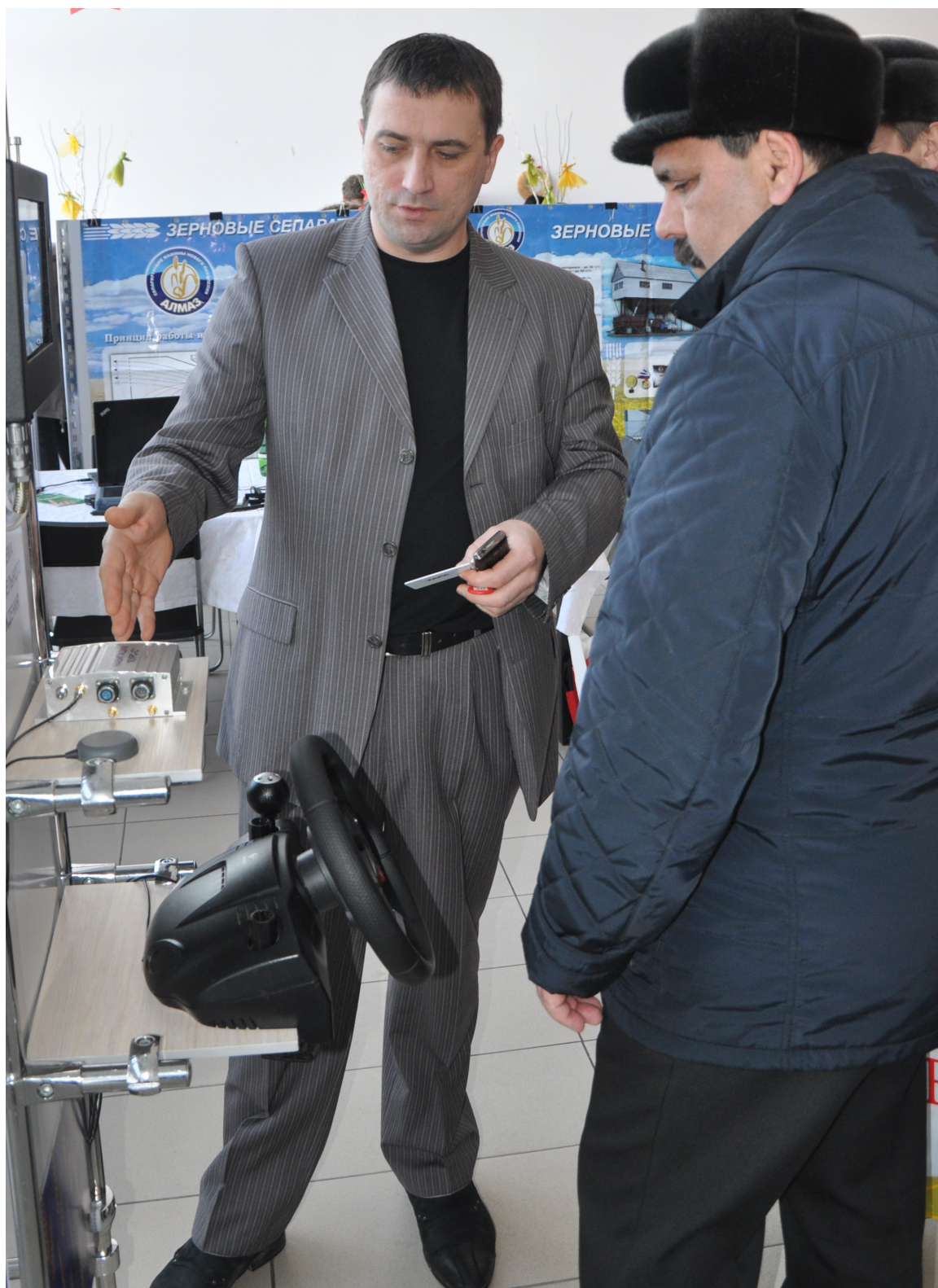
Исетских аграриев заинтересовало навигационное оборудование, позволяющее значительно экономить ресурсы