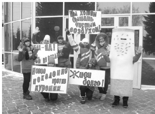
Вая отказаться от этой пагубной привычки.

На этот раз добровольцы проводили своеобразный социальный эксперимент, предлагали им выразить своё отношение к курению в виде положительного или отрицательного знака на огромной сигарете, в которую был одет один из активистов. Конечно же, помимо этого волонтеры успели напомнить прохожим о вреде курения, призывая отказаться от этой пагубной привычки.