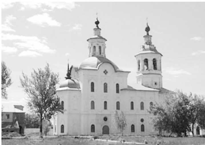
символизируют вход в Царство Божье.

Иконостас имеет трое врат. Центральные, самые большие, называются Царскими вратами. Царскими они называются потому, что