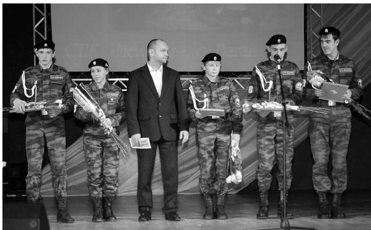
Награждается класс «Медведь» (с.Вагай)