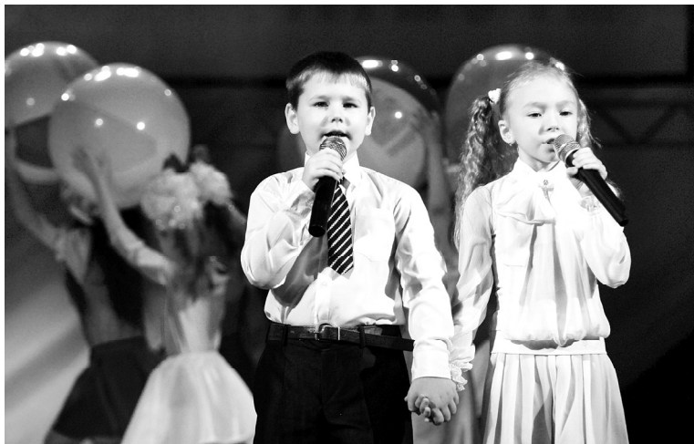
Спортсменов поздравляют юные артисты