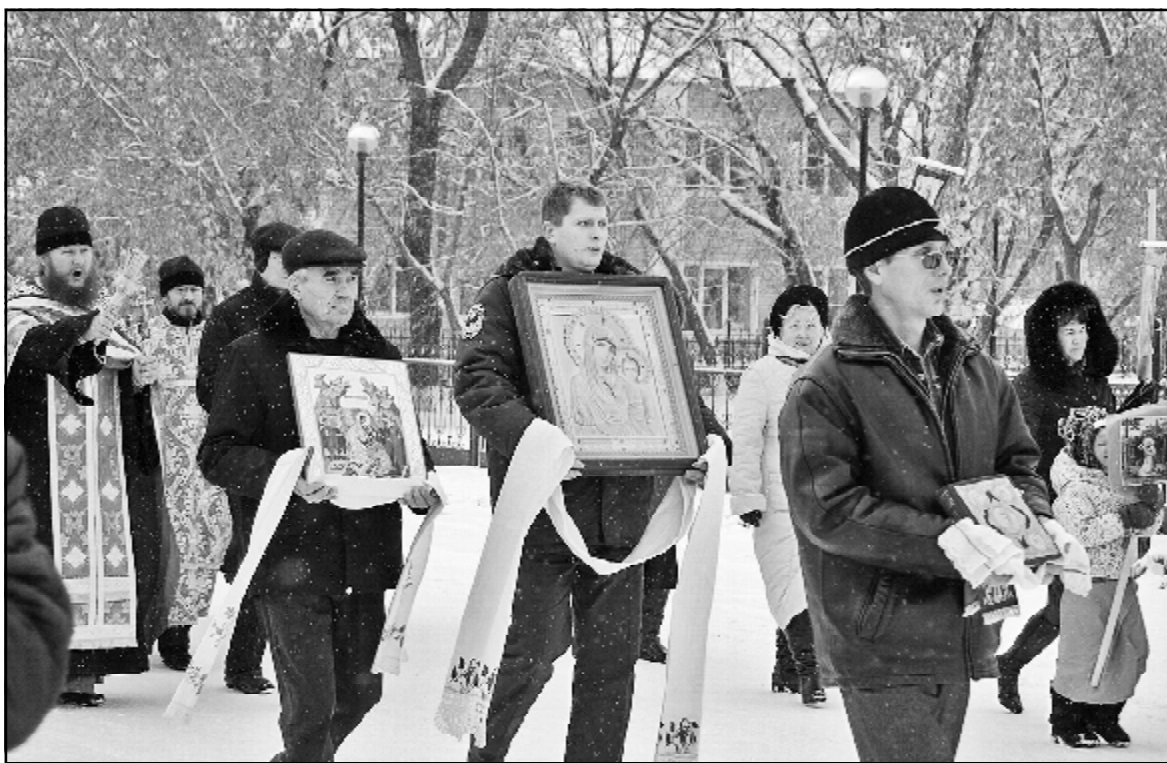
Крестный ход по улицам села Казанского

После крестного хода состоялась праздничная трапеза и концерт в детской школе искусств.