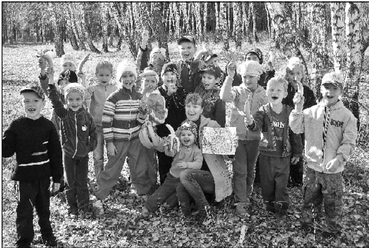
Счастливые минуты в жизни первоклашек