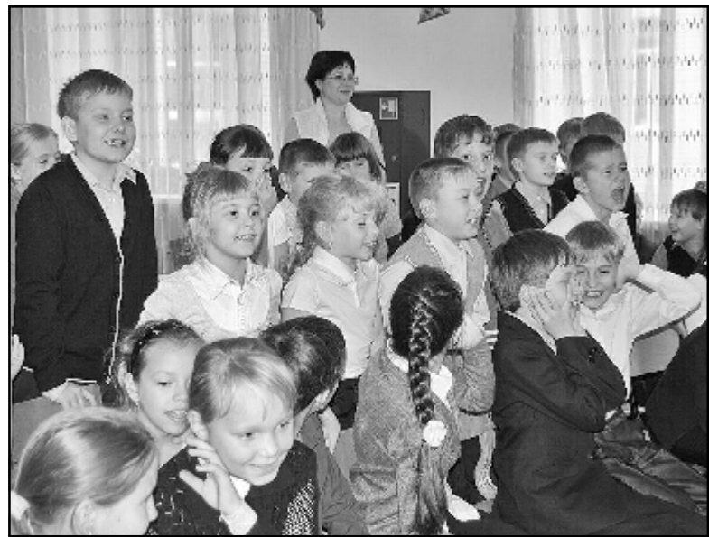
Детям было очень интересно

Православный праздник Покров Пресвятой Богородицы отмечался 14 октября. Для учащихся третьих классов Казанской школы педагоги центра развития детей подготовили и провели мероприятие, посвящённое этому празднику.