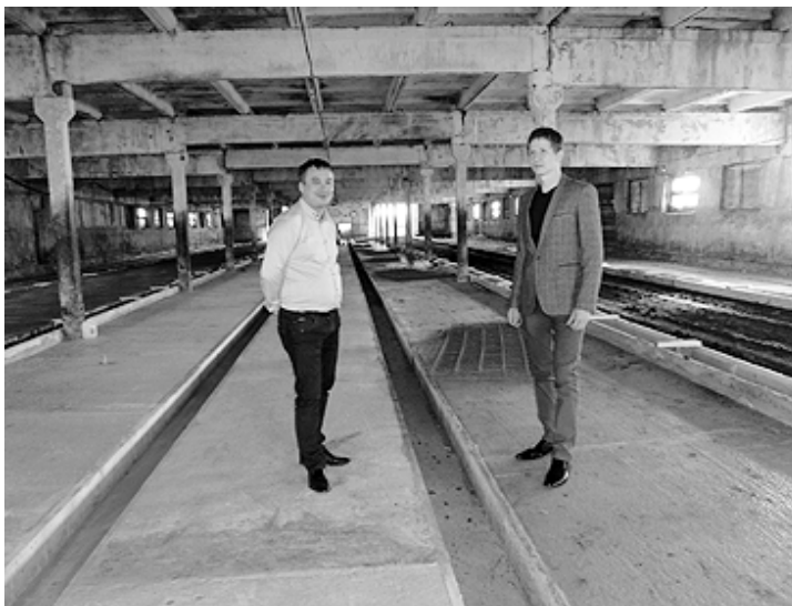
Р. ПАШКОВСКАЯ. Фото автора.

По данным на 23 октября, работники ДРСУ заасфальтировали территорию фермы на 30 процентов. Работы продолжаются. А вот в базе единственное, что сегодня готово, — бетонный