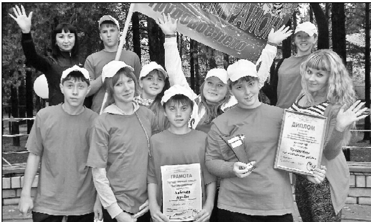
Наши ребята покорили всех своими талантами и прекрасным настроением