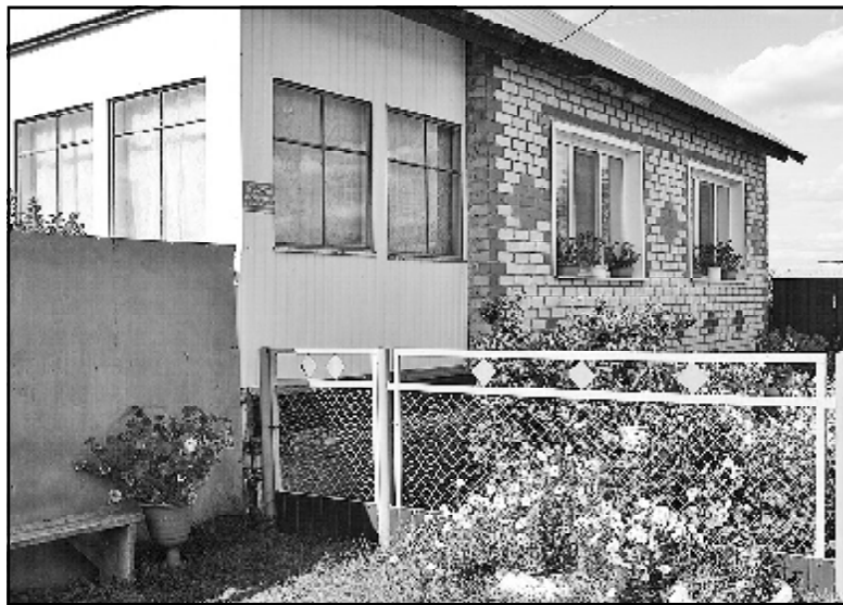
Дом семьи Носенко украшает Шадринку