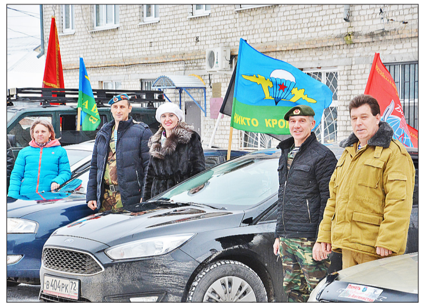
Задора и хорошего настроения им не занимать

Конечная точка – памятник погибшим в локальных войнах и вооружённых конфликтах. Почтить память земляков, ветеранов Великой Отечественной войны, тех, кто исполнял служебный долг за пределами страны и в других горячих точках, отдать дань уважения ныне здравствующим ветеранам и возложить цветы к подножию памятника пришли ветераны боевых действий, друзья служивших и погибших. Присутствовали