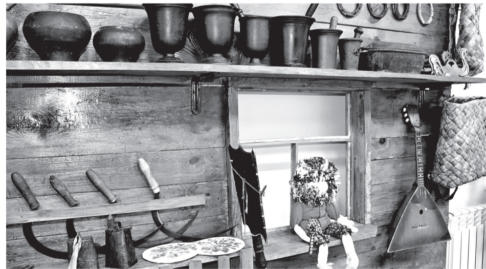
• Новая жизнь выставки крестьянского быта.

В марте 2020 года наконец начался переезд в здание на улице Вокзальной под номером 44. Это одно из немногих исто-