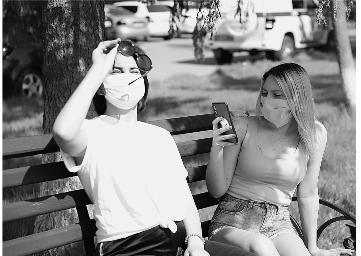
• С 11 мая в Тюменской области разрешено гулять на улице по одному или парами.

А жителям области рекомендую соблюдать правила личной безопасности: носите маску, мойте руки, ограничивайте посещение общественных мест. Берегите себя!