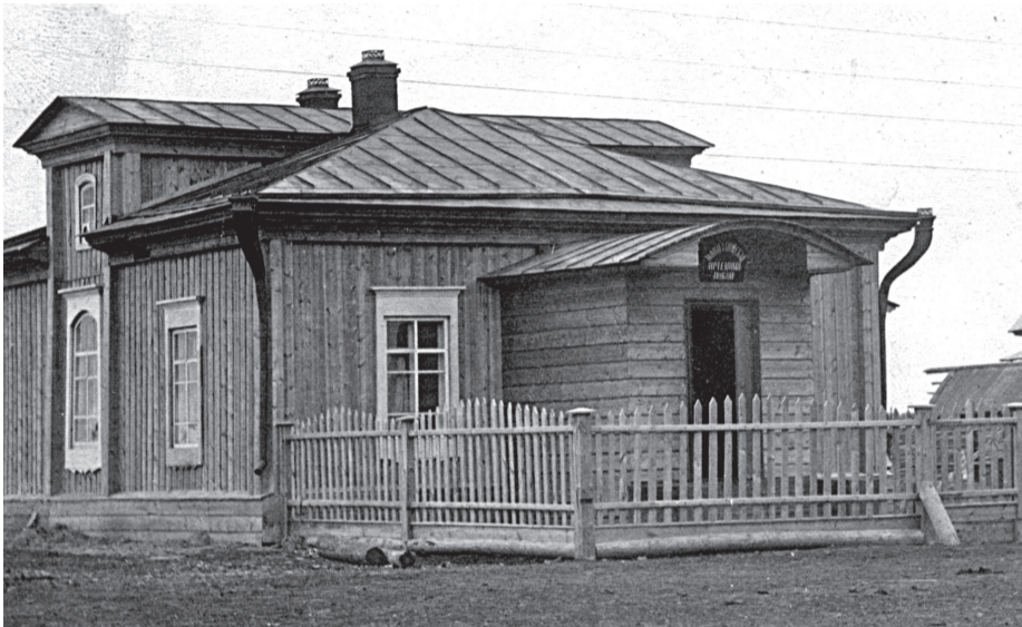
• Новозаимская сельская лечебница, построенная ещё до революции, в 1920 году стала одним из центров борьбы с эпидемией тифа.

Одной из главных задач народного комиссариата здравоохранения РСФСР, созданного 11 июля 1918 года, стала борьба с эпидемиями