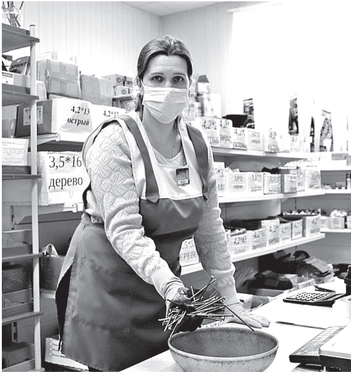
• В условиях пандемии многие магазины, в том числе и строительные, закрыли торговые залы для покупателей, но продолжили работать как пункты выдачи заказов.

Пресс-служба администрации Заводоуковского городского округа