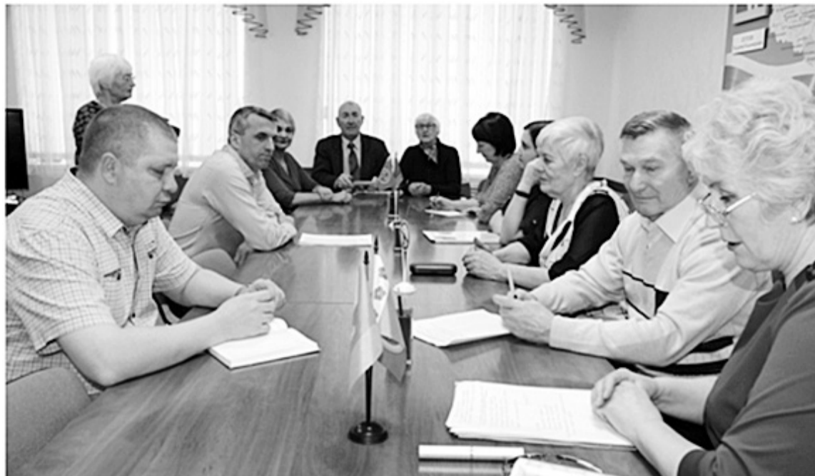
На снимке: идёт заседание Общественной палаты

Что касается онкологических больных, то раньше препаратами их обеспечивал онкодиспансер. Недавно эту