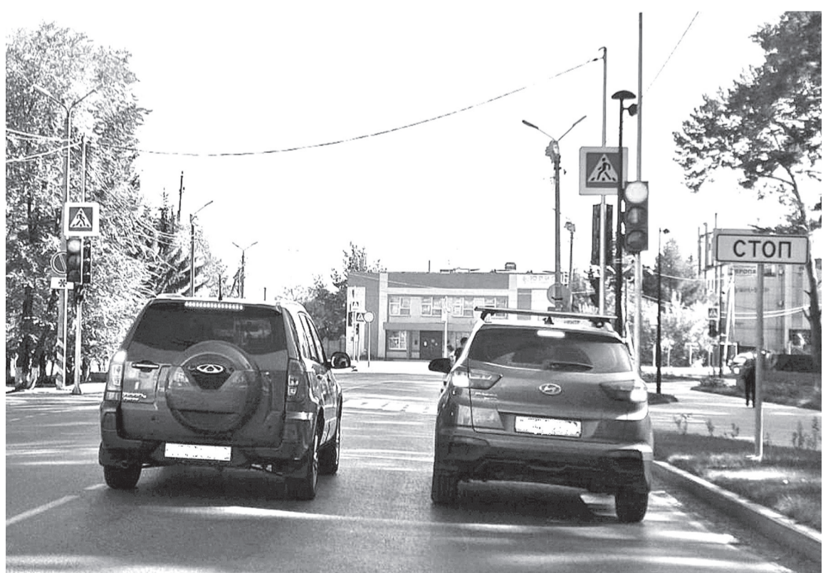
• В минувшую пятницу в конце рабочего дня на перекрёстке улиц Глазуновской и Шоссейной в городе произошло очередное дорожно-транспортное происшествие.

Андрей КОРОСТЕЛЁВ