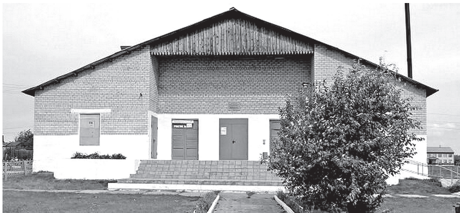
• Первый камень в фундамент Горюновского Дома культуры был заложен 55 лет назад.

Алексей СЕВЕСТЬЯНОВ