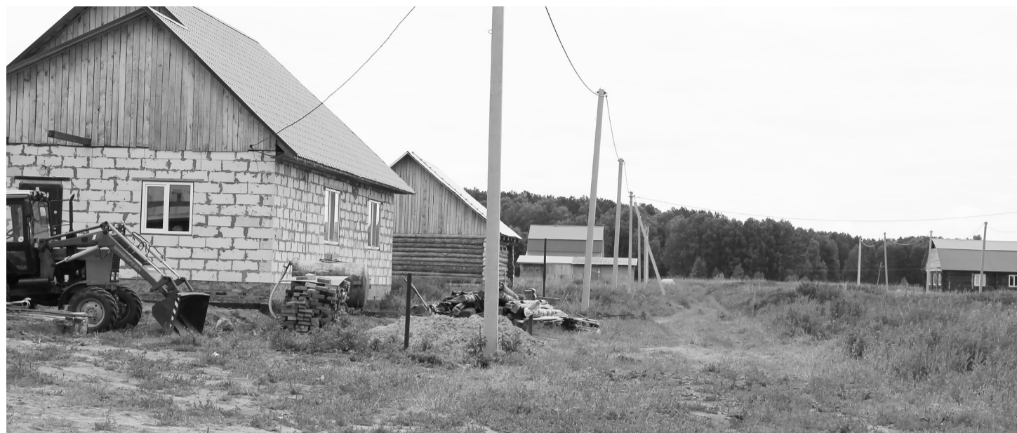
Пока улица Полярная в Нижней Тавде не имеет дороги, а только направление движения. Но она включена в план ремонта на 2020 год, следовательно, жителей ждут положительные изменения.

Новые долгожданные коммуникации появятся во многих населённых пунктах района