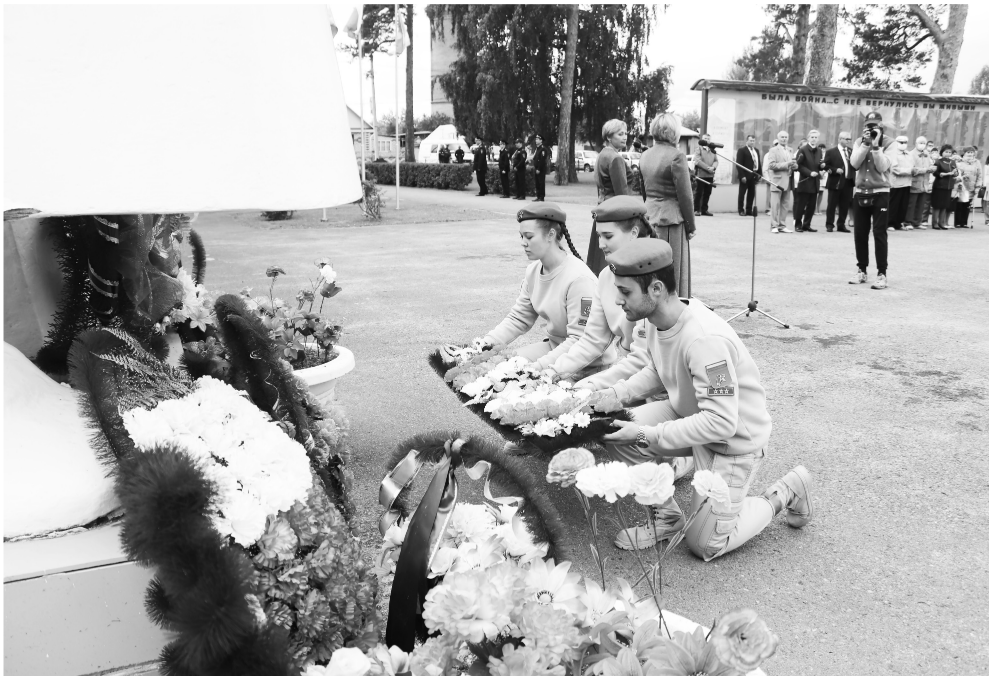
Не только слушатели СГ ДПВС «Русские витязи» прониклись особым духом памятной даты. 22 июня у каждого из нас в сердцах навеки.

Вечно будем помнить этот день и чтить наших героев