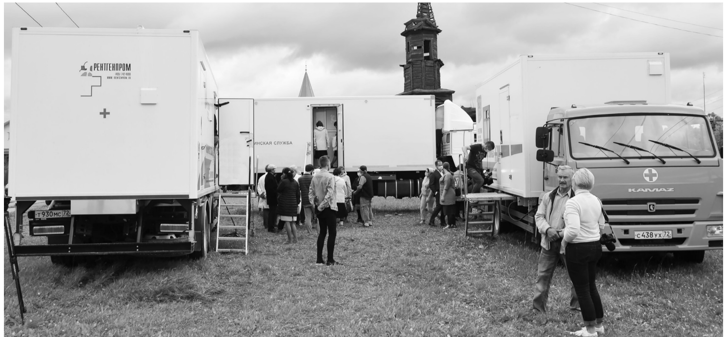
«Автопоезд здоровья» сделал остановку рядом с двумя мечетями (новой и старой – священным памятником верующих). Приём заканчивается, скоро держать путь в Картымскую.

рии областного противотуберкулёзного диспансера, здесь выявляем туберкулёз. Это важное обследование, его обязательно надо проходить раз в году, чтобы не пропустить очень опасное заболевание – туберкулёз. Все, кто пришёл сегодня на приём, который предоставил «поезд здоровья», обязательно делают рентген. Бояться не надо, здесь всё безопасно.