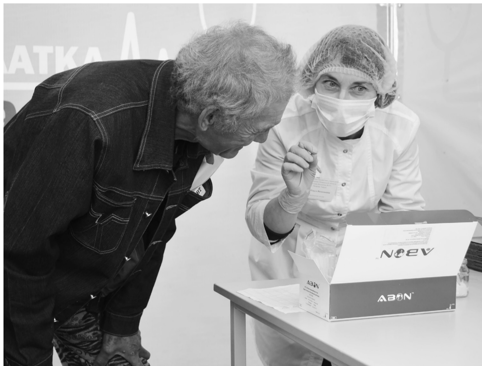
В «Палатке здоровья» обязательно подарят отличное настроение.