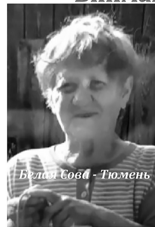
Поисковый отряд «Белая Сова - Тюмень»