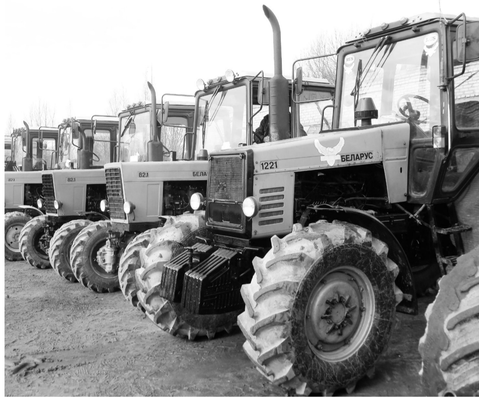
Техника готова. Скоро машины и их владельцев проверят по полной программе.

— Обращаю внимание руководителей организаций и граждан — владельцев тракторов, самоходных машин и мотовездеходов о необходимости соблюдения требований законодательства по вопросам эксплуатации самоходных