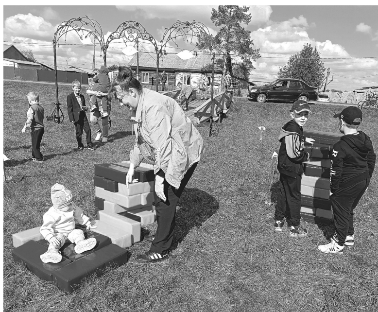
Земляновцы уже полюбили созданную своими руками аллею Дружбы и с удовольствием отдыхают здесь

В этом году работы в аллее Дружбы продолжились. Восстановили мельницу: волонтеры заменили кровлю