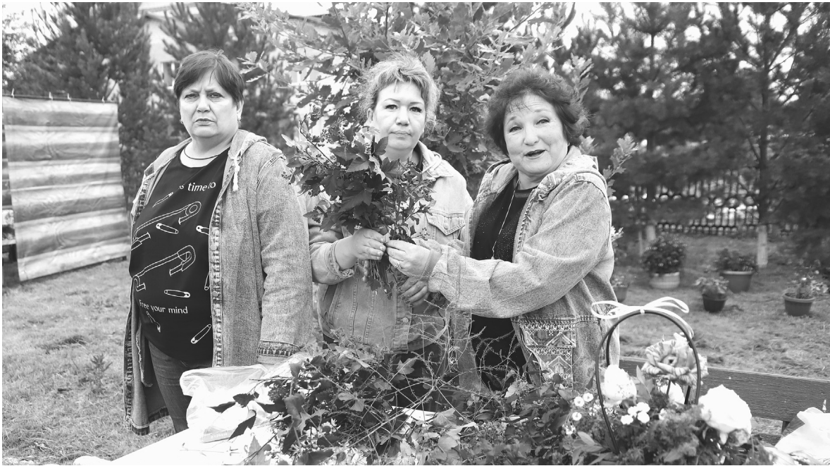
Букеты для гостей составляли по всем правилам флористики

Праздник чувствовался во всём: в пышных букетах георгинов и гладиолусов, в россыпи овощей на столах и в ярких нарядах мастериц. Они представляли свои шедевры из природного материала.