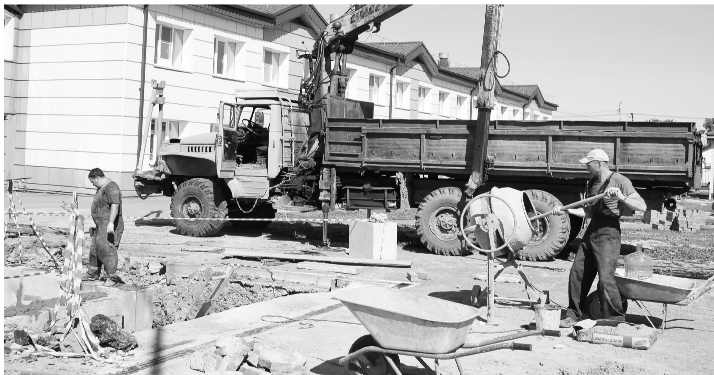
Бригада ООО «Неофит» в процессе работы: в бетономешалке готовится свежий раствор, манипулятор стоит «на стрёме». Тепловая камера (на снимке в нижнем левом углу) скоро будет перекрыта.