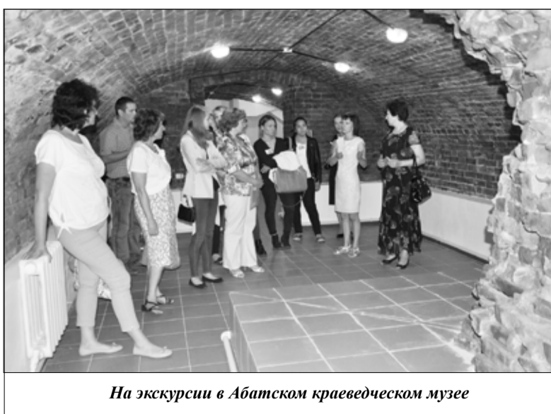
На экскурсии в Абатском краеведческом музее

Открылся Форум приветствием губернатора Тюменской области. В своём видеобращении Владимир Якушев сказал: «Право принимать этот Форум наш регион получил заслуженно. В этом году по данным национального рейтинга инвести-