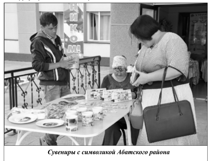
Сувениры с символикой Абатского района