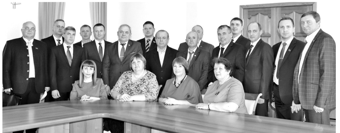
• Раскачиваться депутатам думы городского округа нового созыва некогда – впереди много дел.