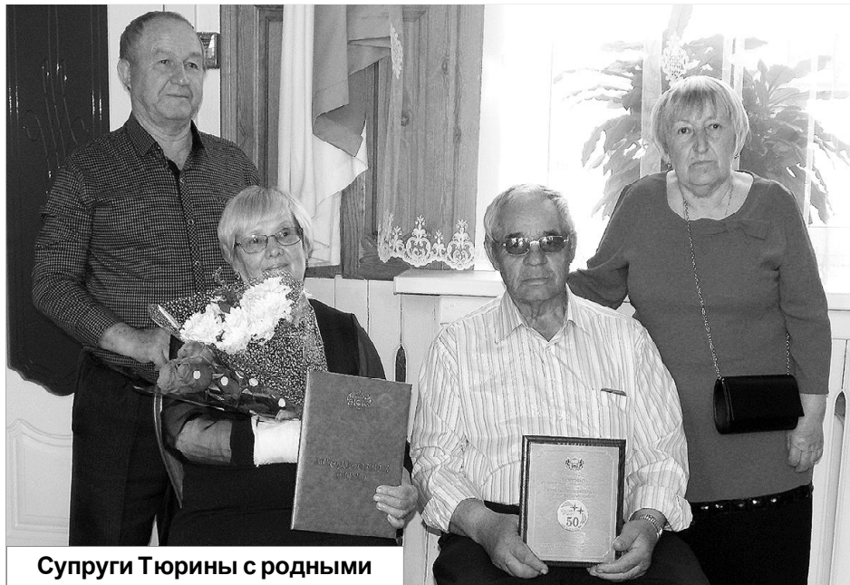
Супруги Тюрины с родными