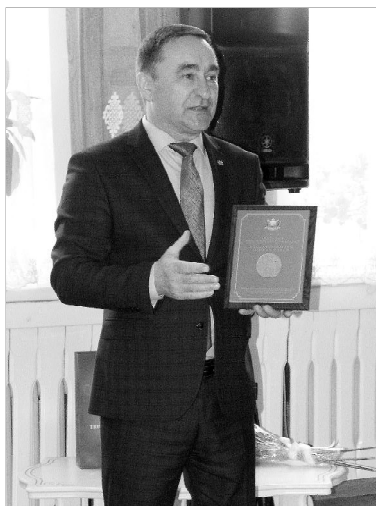
Глава района вручает юбилейную награду