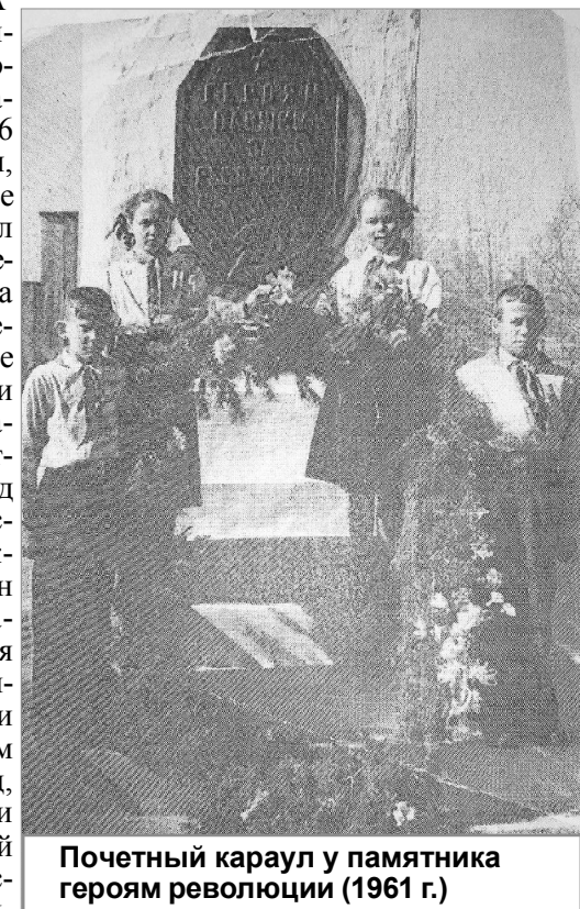
Почетный караул у памятника героям революции (1961 г.)

ся 19 мая – в день рождения Всесоюзной пионерской организации имени В.И. Ленина. В Союзе Советских Социалистических Республик этот праздник являлся одним из главных для школьников. Традиции пионерию живут до сих пор и берутся на «вооружение» нынешними детскими организациями. Пионер и сейчас всем ребятам пример!