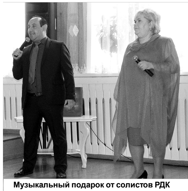
Музыкальный подарок от солистов РДК