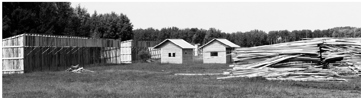
Тетеркинское отделение: идет строительство баз, готовы еще два домика для работающих в полевых условиях