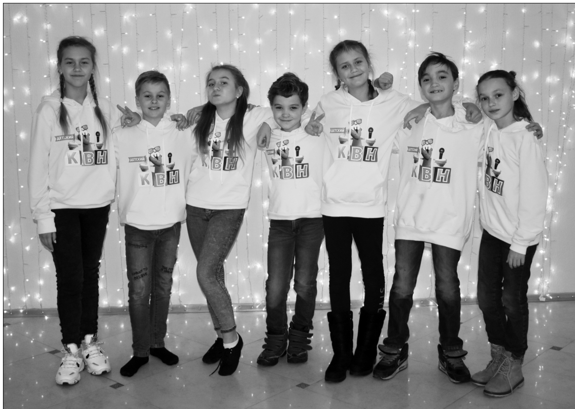
Ребята стремятся покорить еще одну вершину - выступить в телевизионной лиге КВН