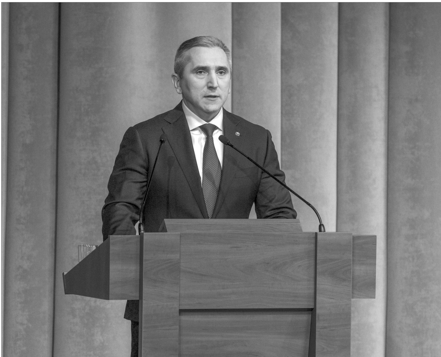
Губернатор предложил увеличить социальные гарантии для тюменцев