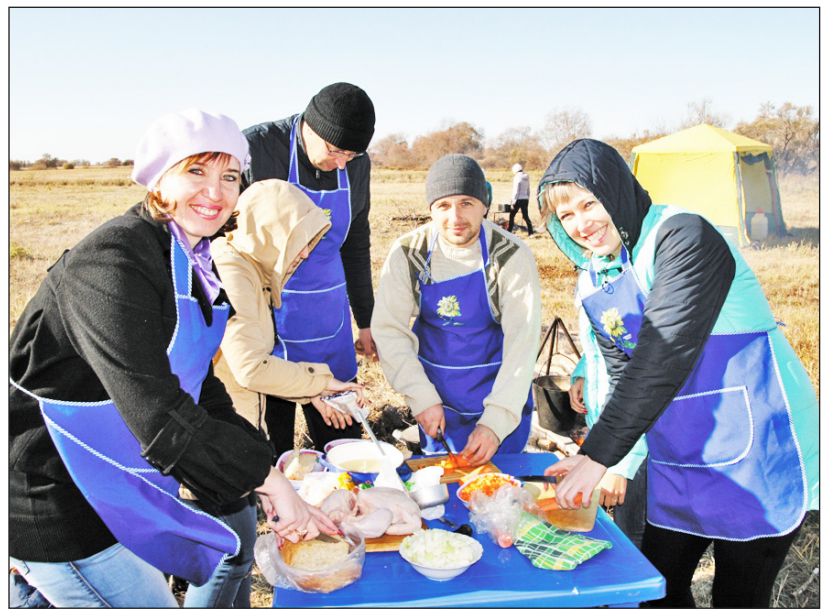
У казанской команды в синих фартуках получился самый вкусный плов

ру, но этого не произошло. Наскоро, разбив стоянку, мы, промокнувшие до нитки, сидели в палатках. Огонь не развести, не согреться и не приготовить еду. На ужин всем раздали сухой паёк, но никто даже не думал ныть и плакаться. Наоборот, мы сидели, укутавшись кто во что, ели консервы, шутили и периодически чьим-то свитером вытирали лужу посреди палатки. А на следующий день выглянуло долгожданное солнце. И весь наш туристический отряд самозабвенно сушился под тёплыми солнечными лучами... Так что я подтверждаю на личном опыте, что походы действительно учат детей преодолевать трудности и раскрывать себя как личность. И никакие соцсети, «лайки», репосты никогда не