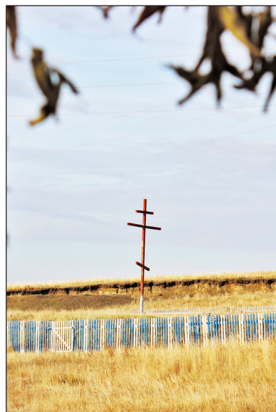
Крест на месте храма... будущего?

Каждый молился о своей жизни, о своих близких и своём уголке Отчизны, да «поживет она жительство спокойное и благое». Господи, пусть воскреснет Ченчерь, пусть не приходится покидать её ради пропитания её детям, пусть возродится там храм и настоящая вера. Ведь где горит светильник веры – туда и стремятся люди.