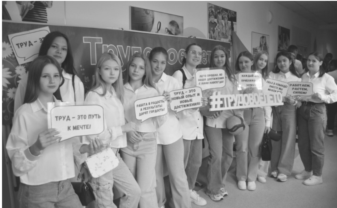
Команда вожатых Бердюжской школы поделилась своими впечатлениями о работе в лагере