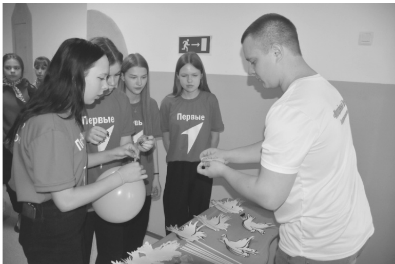
Ребята участвовали в акции «Голубь мира»