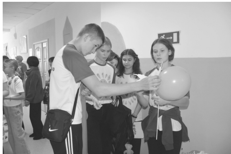
Трудовая бригада из Старорямовской школы