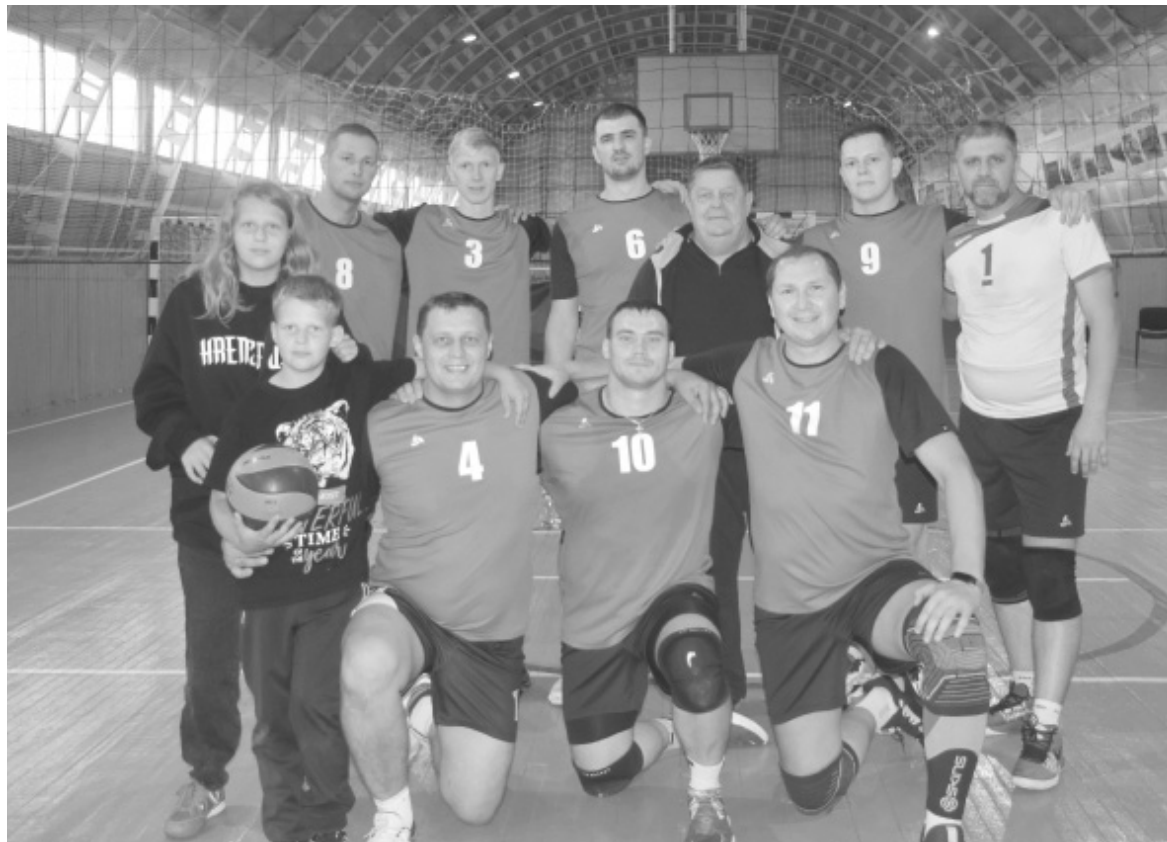
Команда Бердюжского района по волейболу