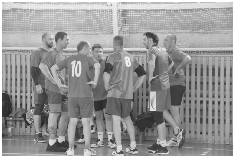
В тайм-аут у команды есть время обсудить тактику игры