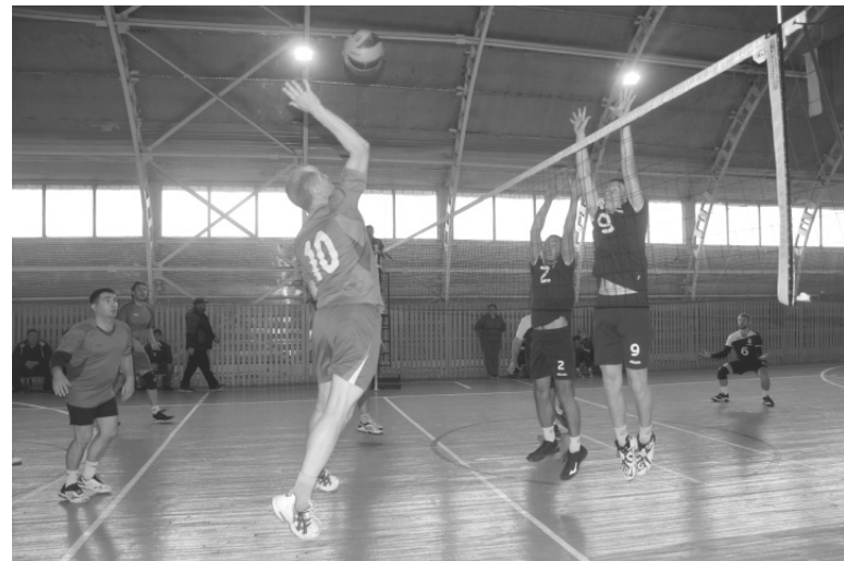
На площадке – упорная борьба за мяч

волейболисты из Абатского и Казанского. Абатские спортсмены уверенно начали первую партию, вели в счете и выиграли со счетом 26:24. Но в следующих двух партиях в игру активно включились соперники: второй и третий