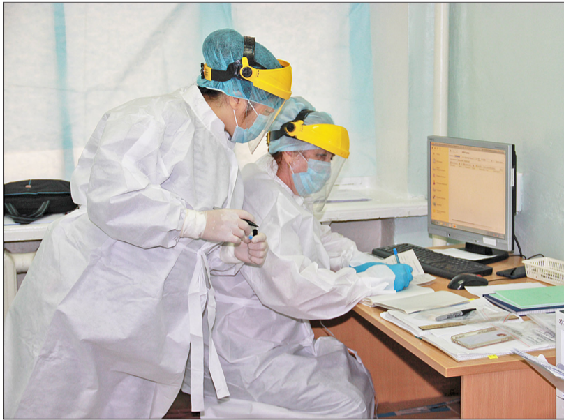
Ежедневно медработники составляют список больных для выезда к ним на дом, и, как правило, он довольно обширен

– А если человек контактировал, например, с коллегой, у которого позже подтвердился коронавирус, ему тоже нужно сдавать анализ? – Во-первых, необходимо выяснить, действительно ли человек является контактным лицом, для этого надо позвонить заболевшему и уточнить дату появления у него симптомов заболевания: заразным он был в течение инкубационного периода (14 дней). Во-вторых, при соблюдении социальной дистанции с заболевшим, использовании маски, перчаток (либо регулярной обработке рук антисептиками) человек защитил себя от заражения и не является контактным лицом. Если же он находится с заболевшим в одном кабинете большую часть рабочего времени, то его можно причислить к контактным. Чтобы человек попал в базу контактных лиц, работодатель должен сообщить данные такого работ-