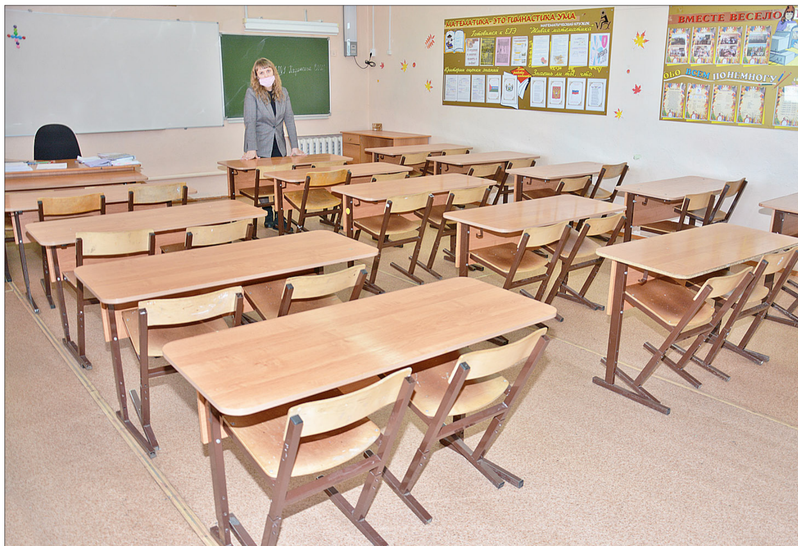
Многие классные комнаты пусты, но учебный процесс не прерывается

Школы Тюменской области по решению оперштаба с 9 по 21 ноября переходят на дистанционный формат обучения