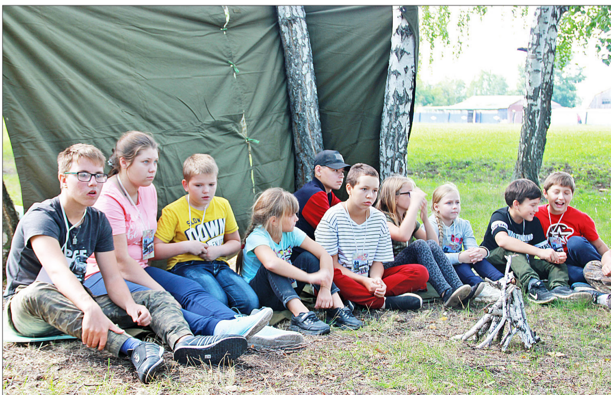
Ребята увлечённо, со всей ответственностью выполняли задание квест-игры «На привале»: по проигранной мелодии угадывали песни военных лет