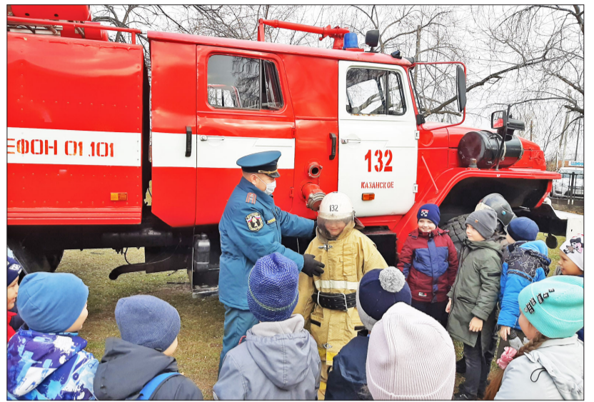
Мальчишки охотно примеряют профессиональную форму пожарного

Сотрудники отдела надзорной деятельности и профилактической работы по Казанскому району совместно с работниками 132-й пожарно-спасательной части устроили показ пожарной техники с пожарно-техническим вооружением и аварийно-спасательным инструментом. Они провели урок безопасности для учеников начальных классов Казанской средней школы. В ходе этого мероприятия представители МЧС напомнили ребятам правила безопасного поведения не только в образовательном учреждении, но и в быту, а также объяснили порядок использования первичных средств пожаротушения. Также были отработаны действия учеников и преподавательского состава учебного заведения на случай чрезвычайной ситуации.