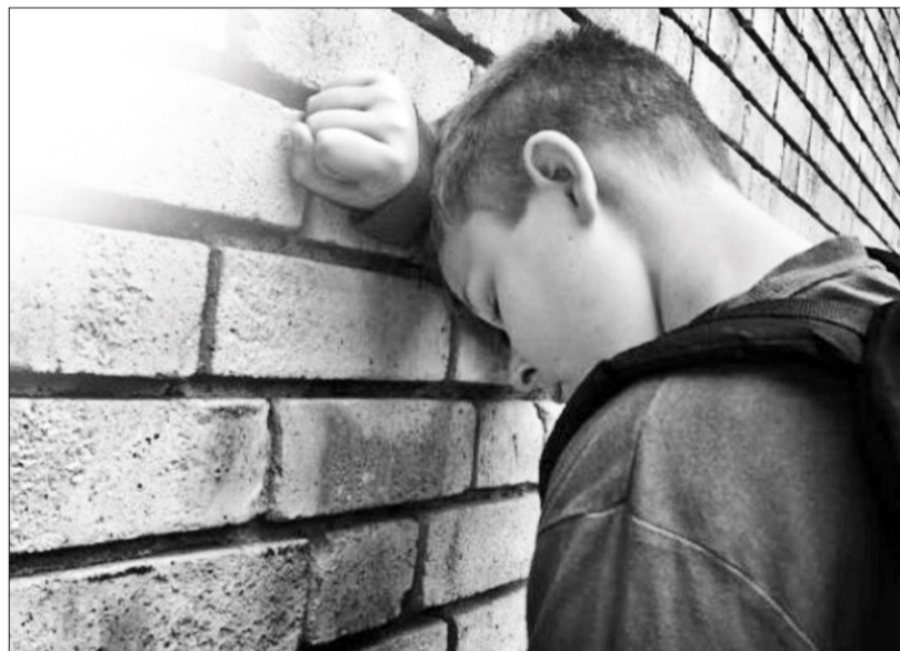
Помогите ребёнку понять, что после чёрной полосы в жизни обязательно наступит белая

Подросткам 12 – 16 лет приходится сталкиваться сразу с несколькими серьёзными задачами, которые ставит перед ними социум: занять подобающее место в среде сверстников, испытать свои силы и способности, определить круг своих интересов в жизни и выстроить