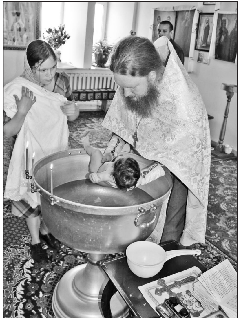
В крещении человек рождается заново, и теперь уже – с Крестом